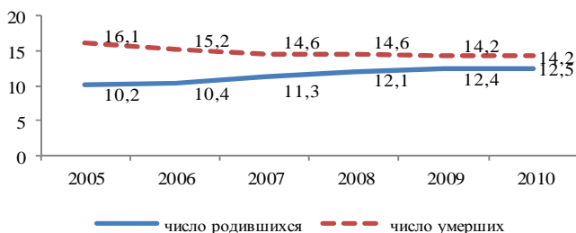
Рис. 2. Коэффициенты естественного движения населения по России на 1 000 чел. населения

Аналогичная ситуация отмечается и по Российской Федерации: число родившихся пока не превышает число умерших, но за счет опережения темпов роста рождаемости, естественная убыль населения снижается (рис. 2).