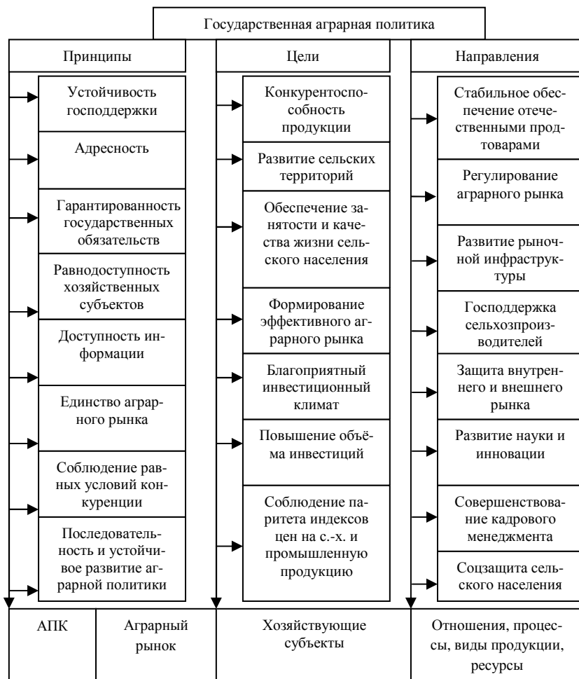
Рис. 2 Основные цели, принципы и направления государственной политики в области аграрного сектора экономики

Нечаев В. И. и Хатуов Д. Х. провели научное обобщение современной практики и изучение основных фундаментальных работ по проблемам государственной аграрной политики и определили ее цели и принципы в области регулирования аграрного сектора (рис. 2) [7, с. 22].