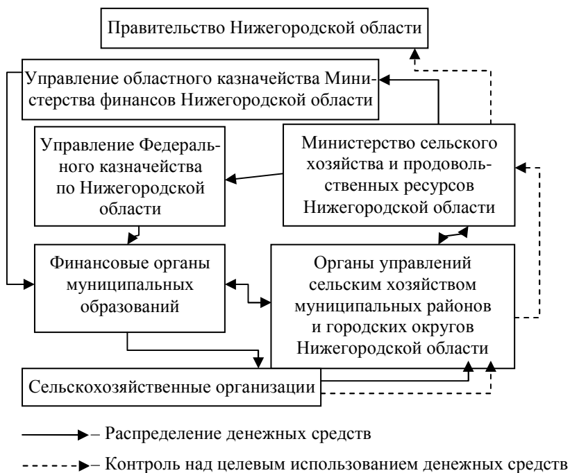
Рисунок 1 – Существующая схема распределения и контроля средств несвязанной поддержки сельскохозяйственных производителей в области растениеводства

– финансовые органы муниципальных районов и городских округов, получившие средства, осуществляют расчеты с получателями при участии органов управления сельским хозяйством [1].