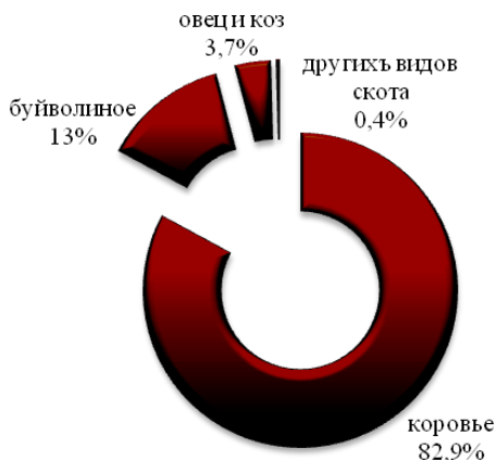
Рисунок 1 – Структура мирового производства молока по видам (от общего объема производства)