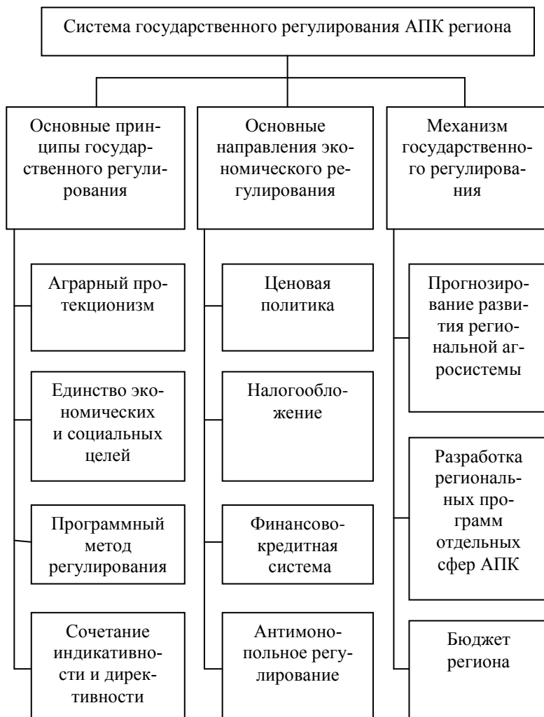
Рисунок 1 – Схема системы государственного регулирования АПК региона

- учет уровня развития в регионе отраслей агропромышленного комплекса, финансовых институтов, кредитно-банковской системы, финансовых возможностей в сфере государственного регулирования сельского хозяйства региона.