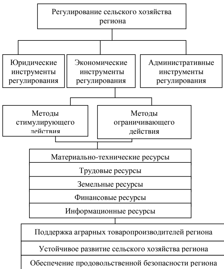
Рисунок 2 – Модель механизма государственного регулирования сельского хозяйства региона