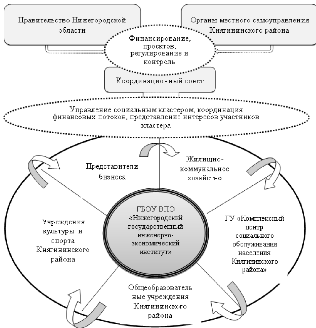
Рисунок 3 – Организационно-экономический механизм взаимодействия элементов социального кластера

Участие бизнеса в развитии социального кластера может осуществляться в форме благотворительности и меценатства; осуществления социальной политики в отношении своего персонала, направленной на улучшение условий труда, качества жизни и т. д.; участия в реализации социальных программ в качестве соисполнителей и их финансирования и пр.